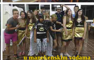
u manekenskim vodomama