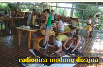
radionica modnog dizajna