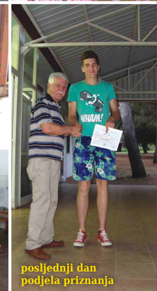
posljednji dan podjela priznanja