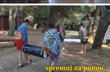
spremni za pomoć