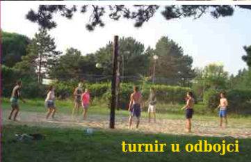
turnir u odbojki