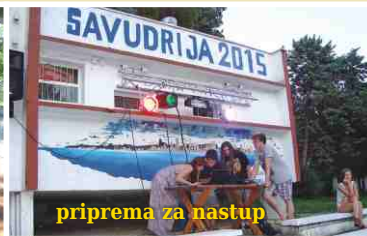
priprema za nastup