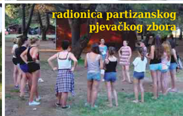
radionica partizanskog pjevačkog zbora