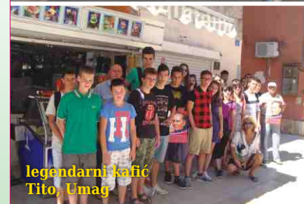
legendarni kafić Tito, Umag