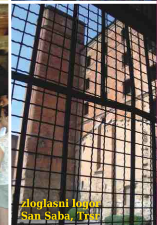
zloglasni logor San Saba, Trst