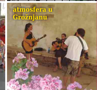
atmosfera u Groznanjanu