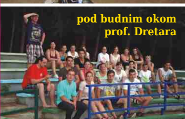
pod budnim okom prof. Dretara