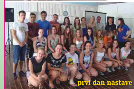
prvi dan nastave