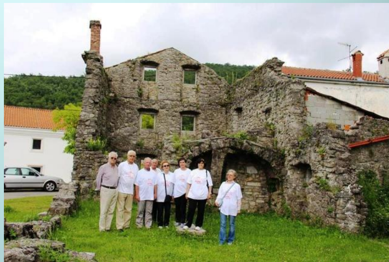
U ostacima spaljenog sela