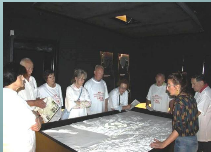
U Muzeju "Lipa pamti"