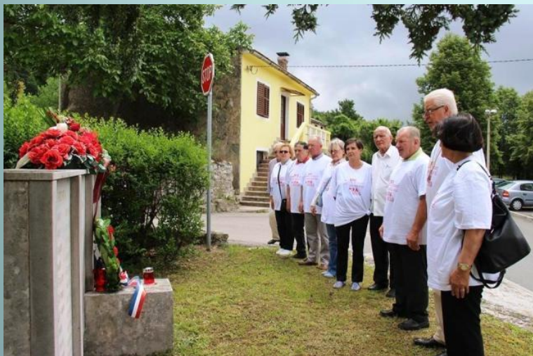
Na polaganju vijenaca i odavanju počasti žrtvama Lipe