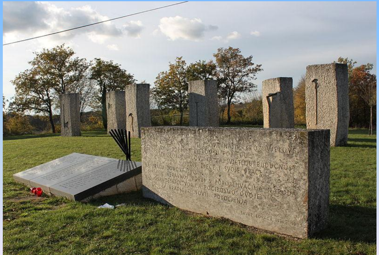
SPOMEN PODRUČJE POGINULIM BORCIMA KOD TIĆANA

Na sedmom, ležećem stupu, stoji natpis: Ispunjeni gorčinom težačkog života otaca naših, djedova naših, kroz vjekove krenusmo u borbu s vjerom u pobjedu za slobodu čovjeka, za svjetliju budućnost svoje djece i svoje braće na pragu domova svojih u neravnoj borbi s porobljivačima naroda nas osamdeset četvorica pogibosmo ovdje za bratstvo novih pokoljenja